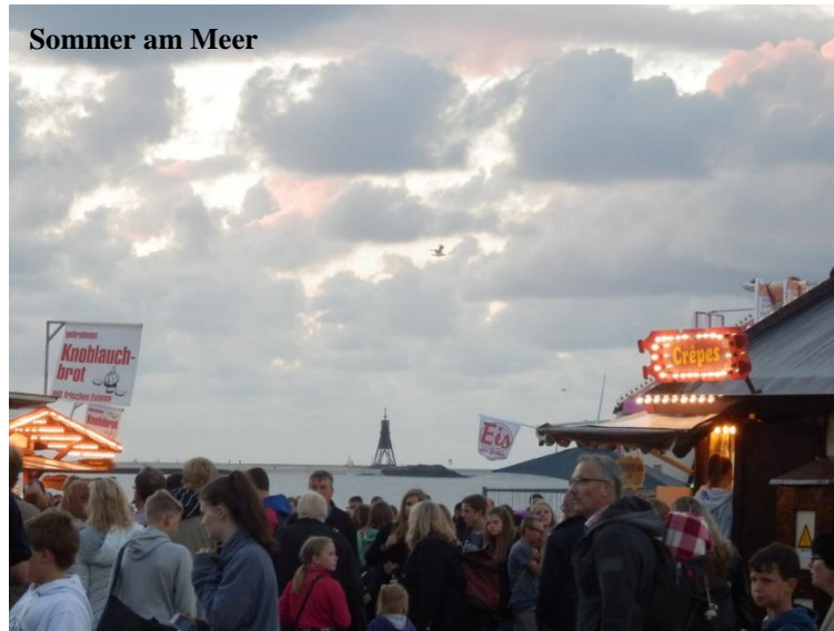
Sommer am Meer

Avec Jette et ses amis, je suis allée à Otterndorfer Altstadtfest, Sommer am Meer et pleins de petites sorties sur la plage le soir.