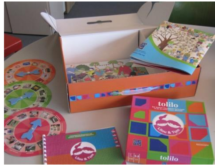
Les plaques tournantes reprenant les photos du jeu tolilo

51 rue de l'Amiral-Mouchez 75013 Paris Tél.: +33 1 4078 18 18 www.ofaj.org