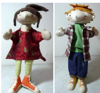
Les marionnettes : Lilou, la Française & Tom, l'Allemand

La Valisette franco-allemande est composée des éléments suivants qui seront utilisés lors des différentes activités :