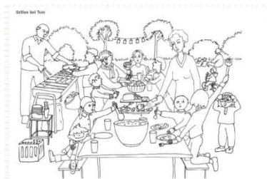
Les planches à colorier représentant des scènes de vie en France et en Allemagne

51 rue de l'Amiral-Mouchez 75013 Paris Tél.: +33 1 4078 18 18 www.ofaj.org