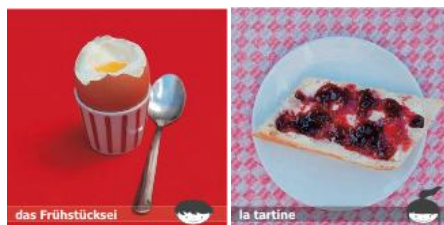
tolilo – Le jeu de cartes franco-allemand