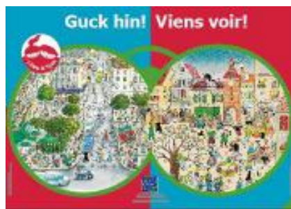
L'affiche Guck hin! Viens voir !

51 rue de l'Amiral-Mouchez 75013 Paris Tél.: +33 1 4078 18 18 www.ofaj.org