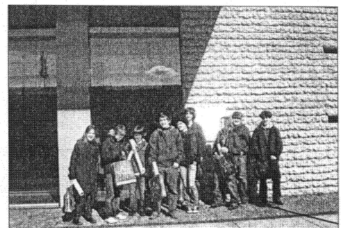
Un groupe de « reporters » franco-allemands devant l'ambassade de France.

P.H.-A.P.J.-M.H.-L.B.-A.V.-A.W.-A.L.-Y.J.-F.H.-J.A.H.-M.P.-K.C.