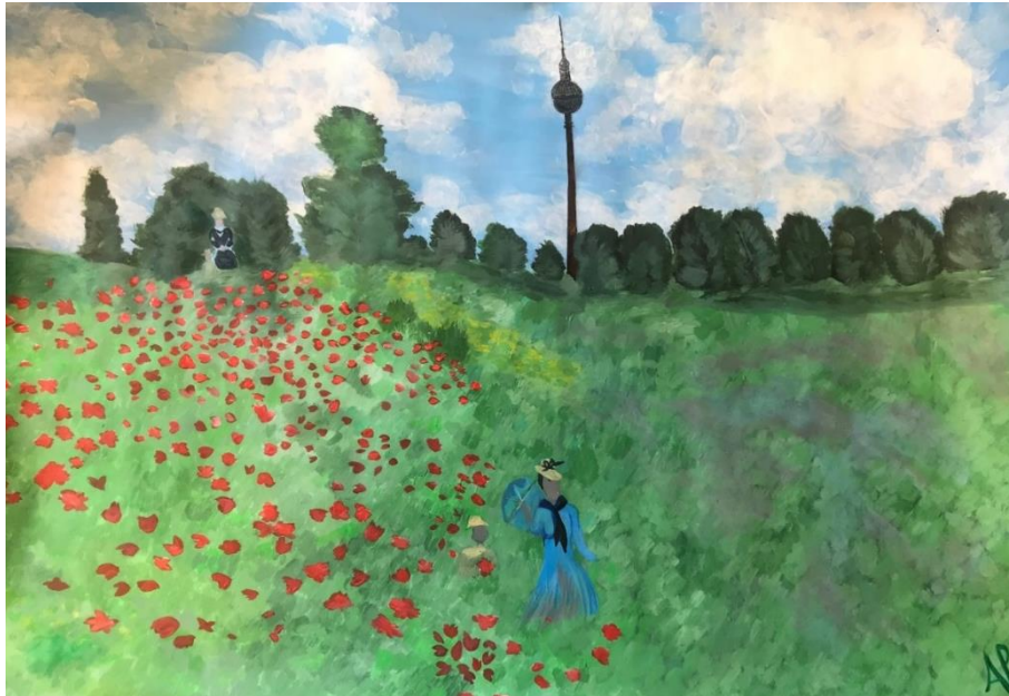
Wenn Monet den Fernsehturm entdeckt...

Die Möglichkeiten reichen von der Begegnung bekannter Persönlichkeiten (z. B. "Dürer rencontre Monet" oder "Das Sandmädchen invite le Petit Prince à son goûter d'anniversaire"... ) über die Erzählung einer deutsch-französischen Klassenfahrt bis hin zur Fiktionalisierung bereits stattgefundener Ereignisse (z.B Unterzeichnung des Elysée-Vertrags am 22. Januar 1963, Spiel Frankreich-Deutschland bei der Fußballweltmeisterschaft 1982, die Erstausstrahlung des deutsch-französischen Fernsehsenders arte im Jahr 1992, usw).